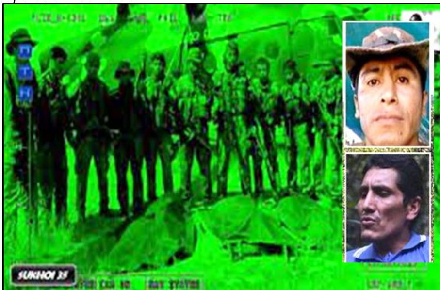
Figura 2 Operación "Camaleón".

Nota: Empleo de unidades del C.I.O.E.C. en operaciones contraterroristas.